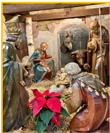
Die Krippe von Sankt Annen, Berlin Lichterfelde