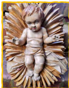
Das Jesuskind in der Krippe Sankt Annen.

„Das Jesus-Kind lächelt nicht nur, es strahlt wieder!“