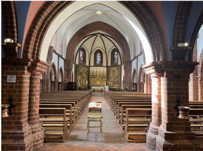
Foto vom 02. Mai 2024, Ausmalung abgeschlossen

Den einstimmigen Beschlüssen des Kirchenvorstands und der wohltuenden Anteilnahme der beiden KV-Mitglieder der Hl. Familie ist es zu verdanken, dass die Bauarbeiten ohne Störungen zügig durchgeführt und das Gotteshaus der Gemeinde Heilige Familie bereits am 01.05.2024 zurückgegeben werden konnte.